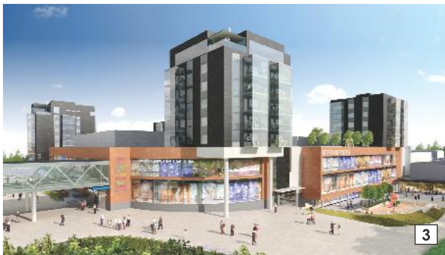
Havainnekuva: CaPman Finesco 2010

Toisinaan keskustan vetovoimaisuus heikkenee kauppojen sulkemisaikojen jälkeen, ja myös talvisin keskustassa on vähemmän ihmistä. Suuria kauppakeskuksia rakennettaessa on tärkeää pitää huolta siitä, että keskustan autioitumisvaaraa ei ole. Eri-tyyppisen ongelmallisia ovat kauppakeskusten niin sanotut passiiviset julkisivut, joissa ei ole kauppojen ja ravintoloiden ovia tai näyteikkunoita, sillä ne on suunnattu kaupakeskusten sisätiloihin. Willaan ja Ykköskortteliin on tulossa myös asumista, mikä auttaa pitämään keskustan eloisana myös aukioloaikojen ulkopuolella. Eri toimintojen sekoittaminen onkin erittäin suositeltavaa, sillä se lyhentää matkojen etäisyyksiä ja mahdollistaa useampien matkojen tekemisen kävellen tai pyörällä.