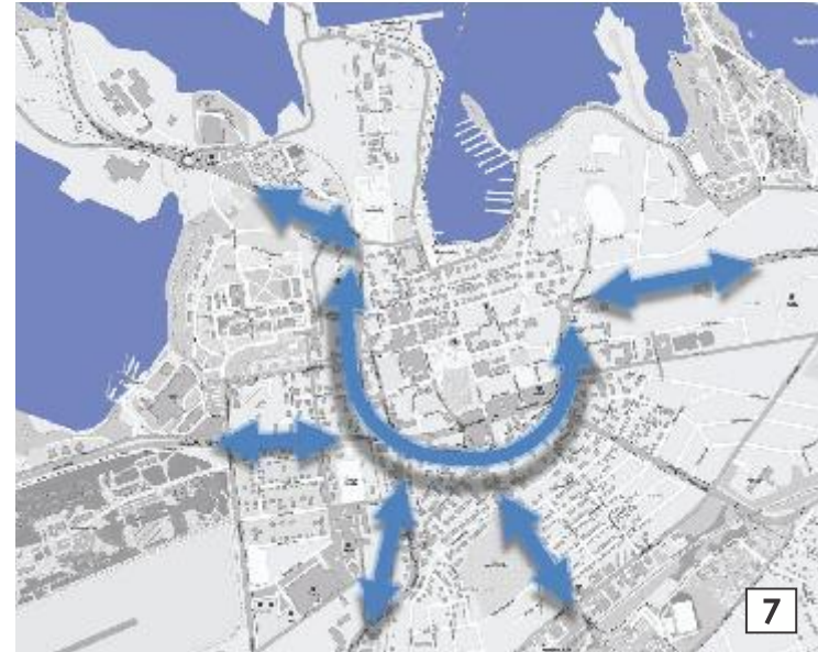
Karttapohja: OpenStreetMap contributors, CC-BY-SA

Keskustan kehäkadun selkeyttäminen helpottaisi autoliikenteen liikumista sekä vähentäisi autoliikennettä keskustasta edelleen. Sisäntulokatuja liittymistä kehälle voisi yksinkertaistaa.