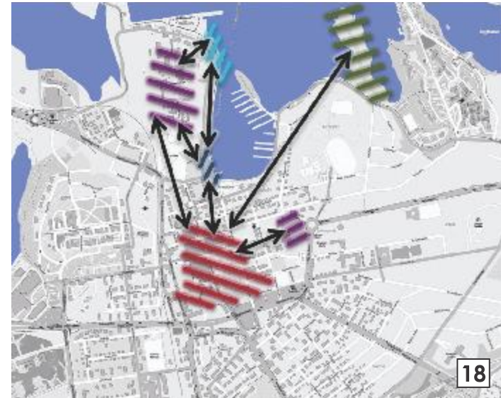
Karttapohja: OpenStreetMap contributors, CC-BY-SA

Lappeenrannan omaleimaisessa keskustassa kävelyolosuhteisiin on kiinnitetty huomiota.